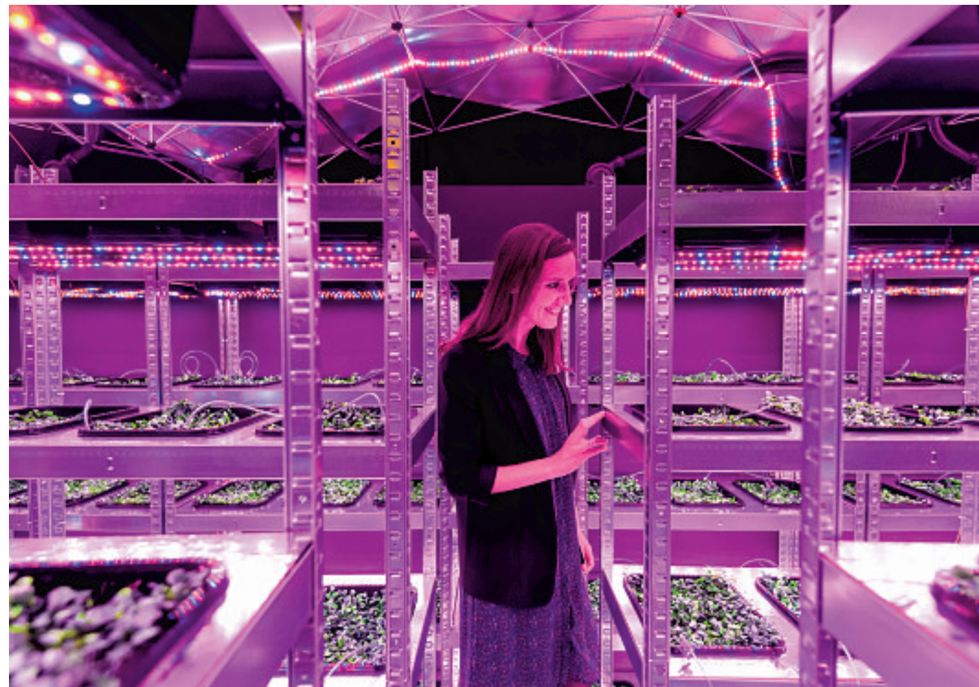
Rechts: wie sturen we naar Mars? Vrouwen zijn kleiner dan mannen en hebben dus minder eten nodig.

De zelfvoorzienende stad die Musk op Mars wil bouwen, zal dus een soort kaasstolp moeten zijn, die de bewoners beschermt tegen de dodelijke buitenwereld. Zouden mensen echt op zo'n plek willen wonen, kunstmatig in leven gehouden in een gigantische couveuse? Jeff Bezos denkt van wel.