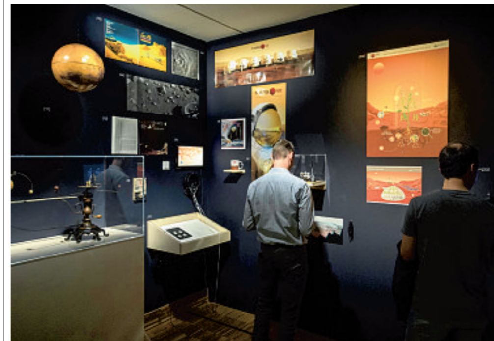
Een kamer met attributen die Mars in de populaire cultuur laten zien.

over Mars-bewoners die de aarde willen overnemen. Mensen zijn kansloos tegen het superieure wapentuig van de marsmannetjes, zoals een hittestraal en giftige zwarte rook. Maar dan sterven de buitenaardse bezoekers plots massaal, geveld door aardse bacteriën en microben.